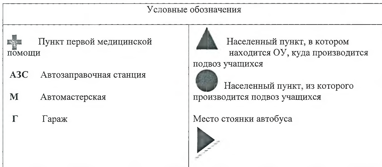
Схема маршрута с указанием линейных, дорожных сооружений и опасных участков