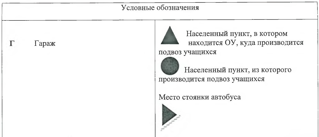
Схема маршрута движения специального транспортного средства составлена с учетом рекомендаций к составлению схемы маршрута движения автобуса образовательного учреждения.